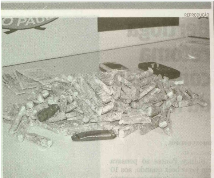
Policiais encontraram 268 porções da erva na casa do acusado